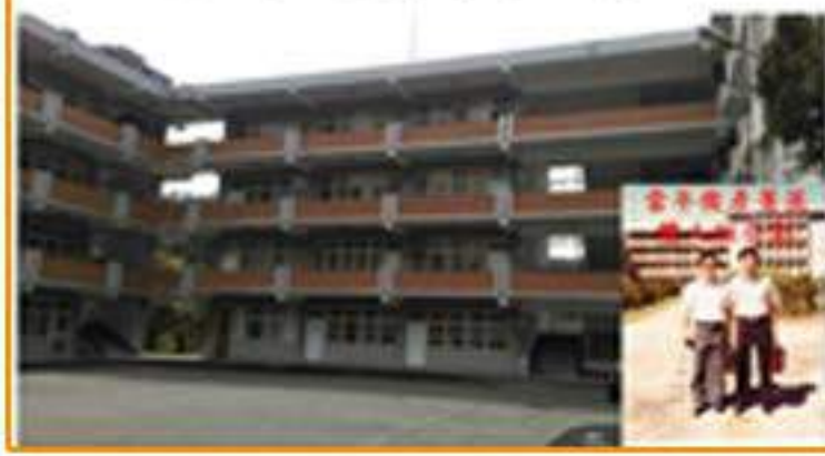
民國59年春隨同國際關係研究所遷至文山區萬壽路64號