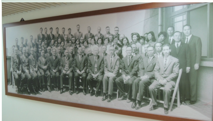
圖為目前掛放在所長室門外的大合照。

親愛的所友們，您們還記得相片中的誰呢？ 是否勾起您們在東亞所學習和成長的回憶呢？ 衷心期盼聆聽您們的青春故事。